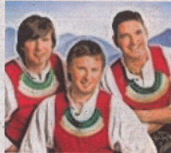
Trio Alpin: Die Burschen aus dem Zillertal werden wieder für Stimmung pur sorgen.

Zwei Festzelte - das große sowie ein Disco-Zelt mit Top-DJ Stav - erwarten wieder die Gäste. Schirmbars, eine Tombola mit tollen Preisen sowie Grillhendl vom Feinsten gehören mit dazu. Was die Musik betrifft, wird einmal mehr die Post abgehen: Im Vorprogramm zeigt die Band „Die Schinterpalfinger“ (unplugged), was sie alles drauf hat. Ab 21 Uhr steigt dann der Hauptact mit der Top-Gruppe „Trio Alpin“. Die drei Burschen